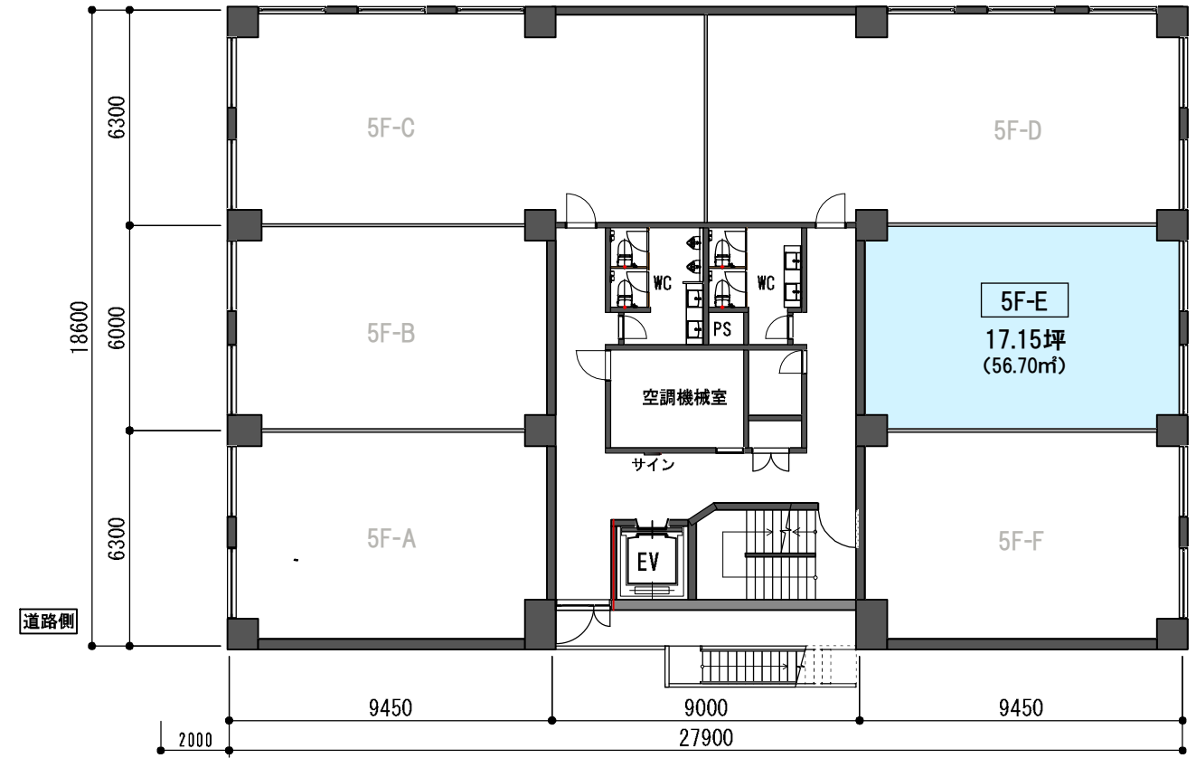
5階 平面図 S=1 : 200