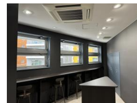
▲ リフレッシュスペース