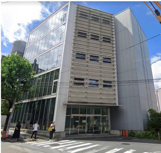
2024年4月リニューアル工事済